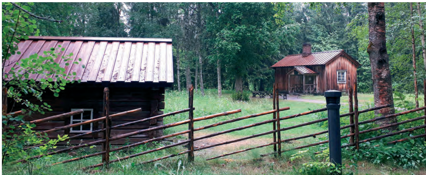
Aleksis Kiven kuolinmökki nykytilassa

Rantatien ja Kirkkotien alueella on vanhan huvila-asutuksen lisäksi puurakenteista pientaloasutusta. Rakennuskanta on uudistunut voimakkaasti 1970-luvulta lähtien, mutta alueen kulttuurihistoriallinen merkitys on yhä hahmotettavissa. Alueen historialliset huvilat ja kulttuurihistorialliset kohteet sijaitsevat asutuksen lomassa molemmin puolin Rantatietä. Vielä paikoin tontteja rajaavat leikatut kuusiaidat, jotka ovat olleet merkittävä puutarhakulttuurinen elementti Rantatiellä. Näkymät peltoaukeiden yli Tuusulanjärvelle ovat vuosien saatossa kasvaneet tai rakentuneet monin kohdin umpeen.