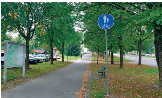
Vehreä katunäkymä Hyrylän keskustassa.

Valtaosa kunnan uudisrakentamisesta ja varsinkin kerrostalotuotannosta tulee sijoittumaan keskustaan. Rakentaminen tulee olemaan tulevaisuudessa korkeampaa, noin 5-8 kerroksista. Koko Hyrylän suuralue kasvaa väestöennusteen mukaan vajaalla 13 000 asukkaalla vuoteen 2040 mennessä. Keskustan alueella toteutuu lähivuosina asuin- ja palvelurakentamisen lisäksi myös uusi liikekeskus sekä opetuksen ja kulttuurin monitoimitalo Monio. Rakentamisen myötä alueesta muodostuu uutta kaupunkimaista rakennettua ympäristöä katualueineen, aukioineen ja puistoinen. Keskustamaisen katutilan muodostumiseen ja käveltävään ympäristöön sekä sujuviin pyöräilyreittein panostetaan. Jalkakäytävien varrella rakennusten ensimmäiset kerrokset tulee suunnitella eläväksi liiketilojen sijoittamisella, suurilla ikkunoilla, sisäänkäynneillä, taiteella tai vastaavien keinoin. Alueelle sijoitetaan taidetta taideohjelman mukaisesti.