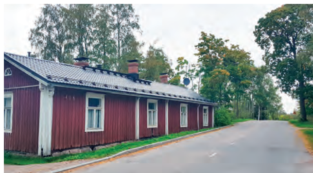
Kirkkotien vanhaa rakennuskantaa

Alue on tyyppiltään museo- ja asuinalue. Julkinen ulkotila keskittyy alueella kulttuurihistoriallisesti arvokkaiden kohteiden sekä käyttöviheralueiden yhteyteen. Kaupunkikalusteiden tulee olla laadukkaita ja kestäviä sekä historiallisiin kohteisiin sopivia. Kunnossapidosta tulee pitää huolta. Museokohteissa kalusteiden sijoittelussa tulee huomioida hetkellinen suuri käyttäjämäärä ja selkeä kulunohjaus. RKY-alueen historiaa korostetaan yhtenäisellä kalusteilmeellä. Kalusteväriä käytetään mustaa museoalueelle tyyppilliseen tapaan. Kalusteiden yleisilmeen tulee olla keveä ja linjakas.