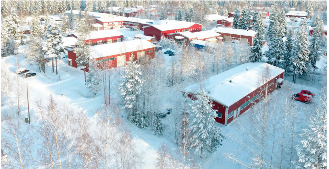
Kellokosken Rajalinnan teollisuusalue

Tuusulan yritysaluekeskittymät sijaitsevat asuinalueiden laitamilla rajautuen tiealueisiin sekä maaseutu-/suojametsäalueisiin. Yritysalueet toimivat työpaikka- ja asiointialueina sekä tuotannon ja varastoinnin alueina. Niiden julkiset ulkotilat ovat lähinnä katualueita