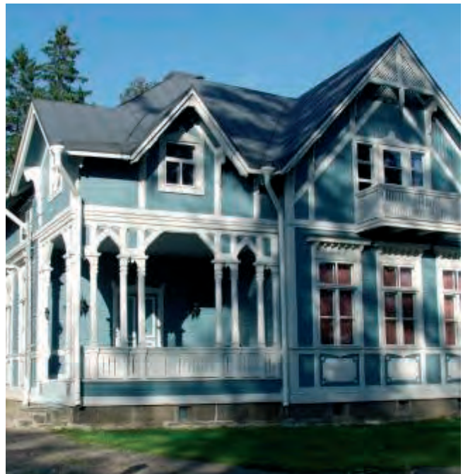
Sininen huvila - virtuaalituusula

Nukarintien eteläpuolella sijaitsee tiilitehtaan alueen vanhin rakennus (rakennusvuosi 1878), jossa toimi tiilitehtaan konttori. Tältä alueelta löytyy myös vanha vanutehdas (rakennusvuosi 1920) sekä vanhan laatikkotehtaan konttori.