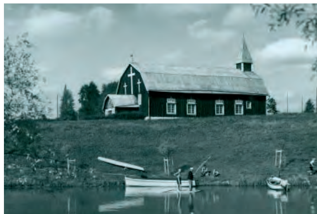
Näkymä Kellokoskelta vuonna 1930.

K ellokoski sijaitsee Tuusulan koillisosassa, kolmen kunnan rajan tuntumassa. Etelässä Kellokoski rajautuu peltoaukeiden takaa Järvenpään ja koillisessa Kellokosken taajama jatkuu Mäntsälän puolella Hyökännummen alueena. Kellokoski on syntynyt Keravanjoen varrelle kartanon, rautaruukin ja sairaalan ympärille ja on yksi Tuusulan kolmesta keskustaajamasta. Kellokosken kyläkeskus sijaitsee keskeisellä paikalla alueen läpi kulkevan Vanhan valtatie ja Koulutien risteyskohdassa, kulttuurihistoriallisesti arvokkaan ruukin ja sairaala-alueen välittömässä läheisyydessä. Kellokosken pientalovaltaiset asuinalueet ovat rakentuneet kyläkeskuksen ja paikallisteiden ympärille.