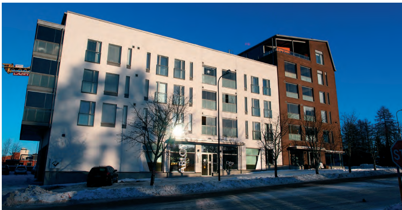
Uutta kerrostalorakentamista keskustassa

Alue on tyylliltään keskustamainen. Julkiset ulkotilat koostuvat pääasiassa aukioista, katualueista, rakennetuista puistoista sekä käyttöviheralueista. Julkisten ulkotilojen laatuso antaa kävijälle ensivaikutelman alueesta. Liike- ja palvelukeskustan käyttöaste on suuri, joten käytettävien materiaalien ja rakenteiden tulee olla korkeatasoisia ja kestäviä. Suunnittelussa tulee huomioida esteettömyys, turvallisuus ja selkeä opastus. Rakennetuissa ympäristöissä viheralueiden käyttöaste on suuri ja puistojen hoitoluokka on alueella keskimääräistä korkeampi. Kalusteiden ja varusteiden tulee olla laadukkaita, kestäviä ja turvallisia. Alueen varuskuntahistoriaa olisi mahdollista tuoda esille ulkotiloissa esimerkiksi ympäristötaiteella.