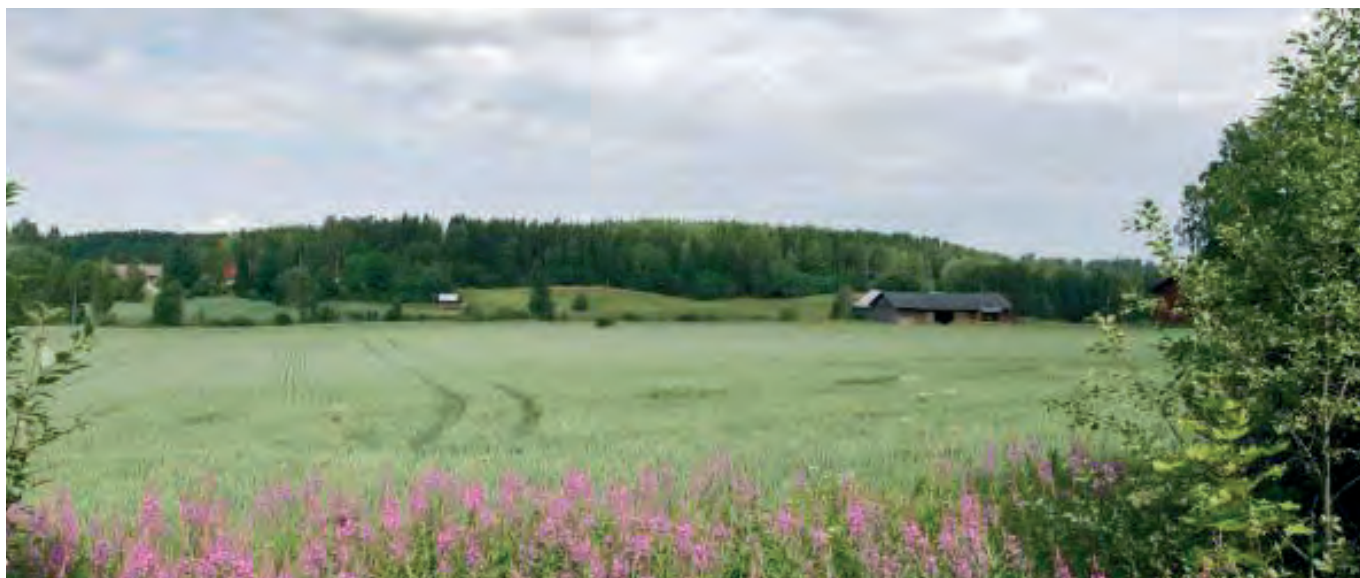
Tuusulanjoki ja jokilaakson kulttuurimaisema

Alue on tyypiltään asuinalue. Alueella on jonkin verran palveluita, kuten kouluja, päiväkotia ja elintarvikekauppoja. Julkista ulkotilaa on katualueiden lisäksi rakennetuissa puistoissa, koulujen piha-alueilla, luonnonmukaisilla viheralueilla sekä virkistys- ja liikunta-alueilla. Käyttöaste vaihtelee kohteittain suuresti. Rakennetuissa ympäristöissä sijaitsevien käyttöviheralueiden käyttöaste on suuri,