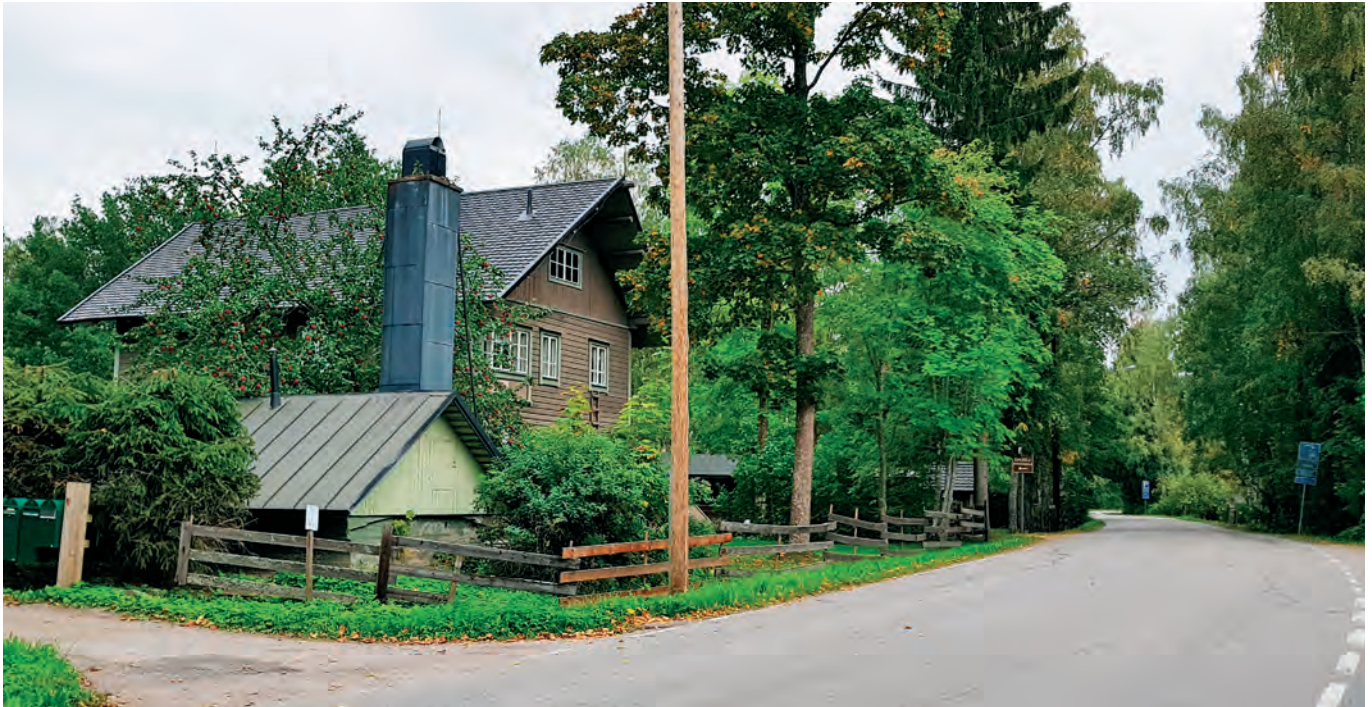
Taiteilijakoti Erkkola nykytilassa

Tuusulanjärven itäpuolella sijaitseva Rantatien alue kuuluu valtakunnallisesti merkittävät rakennetut kulttuuriympäristöt (RKY 2009) -alueeseen. Kirkkotien kulttuurimaisema jatkaa samaa kulttuuriympäristöä Tuusulanjärven eteläpäässä. Historiallisen huvila-asutuksen lisäksi alueella on uudempaa pientaloasutusta. Alueen julkiset ulkotilat ovat kulttuurihistoriallisesti arvokkaita museokohteita, katualueita, rakennettuja puistoja sekä käyttöviheralueita. Alue on kuntakuvan muodostumisen kannalta tärkeä, koska sillä alueella liikkuu paljon matkailijoita.