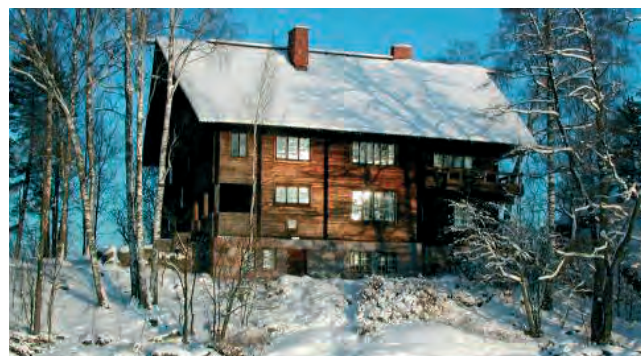
Halosenniemen museo talvella

Alue on tyyppiltään museo- ja asuinalue. Julkinen ulkotila keskittyy alueella kulttuurihistoriallisesti arvokkaiden kohteiden sekä käyttöviheralueiden yhteyteen. Kaupunkikalusteiden tulee olla laadukkaita ja kestäviä sekä historiallisiin kohteisiin sopivia. Kunnossapidosta tulee pitää huolta. Museokohteissa kalusteiden sijoittelussa tulee huomioida hetkellinen suuri käyttäjämäärä ja selkeä kulunohjaus. RKY-alueen historiaa korostetaan yhtenäisellä kalusteilmeellä. Kalusteväriä käytetään mustaa museoalueelle tyyppilliseen tapaan. Kalusteiden yleisilmeen tulee olla keveä ja linjakas.