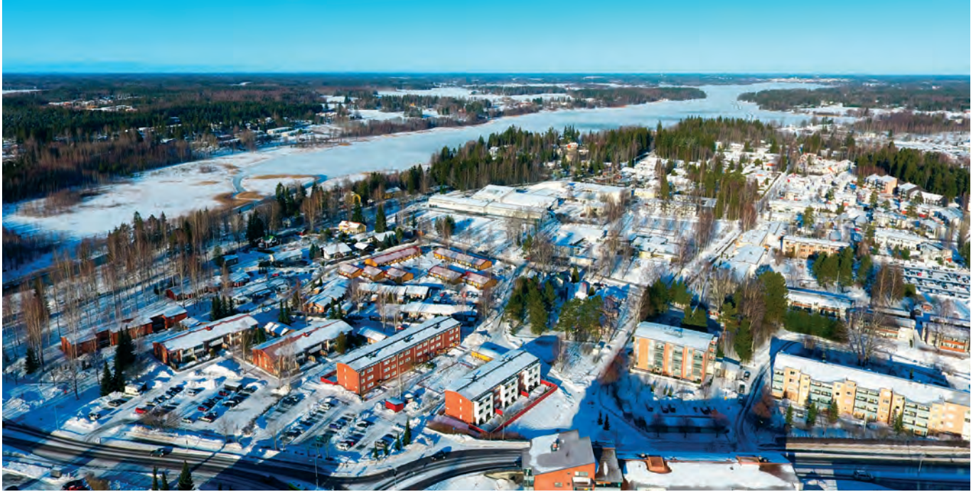
Hyrylän asutusta, näkymä järvelle

Riihikallio, Lahela, Mattila, Rykmentinpuisto, Vaunukangas