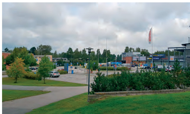
Keskustan kaupan aluetta