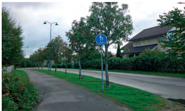
Katutila Lahelan kylässä

joten kalusteiden ja varusteiden tulee olla laadukkaita, kestäviä ja turvallisia. Kunnossapidolla voidaan vaikuttaa alueen yleisilmeeseen ja turvallisuuden tunteeseen. Luonnonmukaiset metsäiset viheralueet sekä avoimet niittyalueet muodostavat tärkeän osan viher- ja virkistysalueverkostoa. Levähdyspaikkojen tulee olla järkevästi sijoitettuja, kestäviä ja hyvin hoidettuja. Erityistä huomiota kiinnitetään kävely-ympäristön laatuun sekä pyöräilyn laatuikäyttöihin.