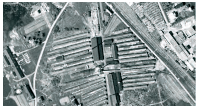
Jokelan Tiilitehdas vuonna 1936

tuli muuta teollisuutta, liikeyrityksiä sekä asukkaita ja muutamassa vuosikymmenessä Jokelasta kehittyi vilkas teollisuustaajama. Tiilitehtaiden lisäksi alueella toimi mm. kattohuopaa, laatikoita, vanuja ja tulitikkuja valmistaneita yrityksiä. Jokelan taajaman rakentumisen aloittanut teollisuus loppui 1900-luvun loppupuolella. Viimeinen tiilitehdas lopetti alueella 1980-luvulla.