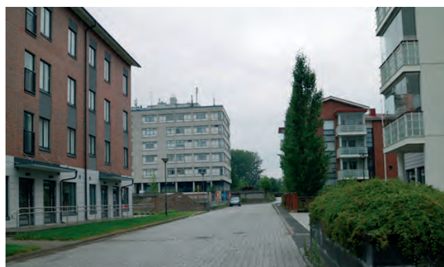
Jokelan uutta kerrostalorakentamista