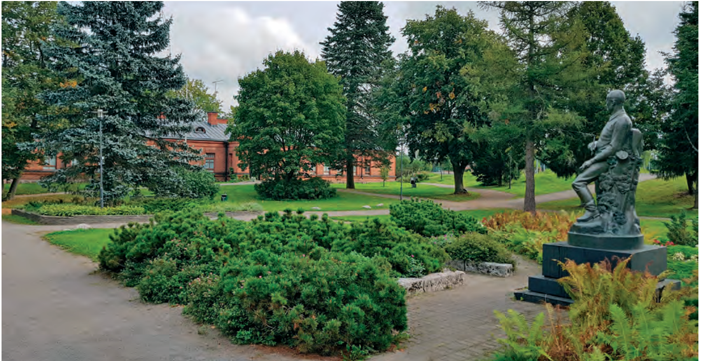
Taidekeskus Kasarmin kaunista puistoaluetta

Tuusulan keskusta toimii liike- ja palvelukeskustana liikenteellisesti tärkeässä solmukohdassa. Alueella on hyvät kaupalliset palvelut sekä monipuolinen vapaa-ajan tarjonta. Alueen julkiset ulkotilat ovat liike- ja palvelukeskustan alueita, museokohteita, katualueita, rakennettuja puistoja sekä käyttöviheralueita.