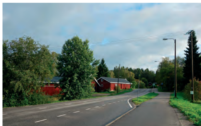
Nauhamaista kyläasutusta tien varrella

Tuusulan yleiskaavassa 2040 on tunnistettu maaseutumaiselle alueelle viisi kyläaluetta; Ruotsinkylä, Rusutjärvi, Nahkela, Vanhakylä ja Linjamäki. Kyläalueille voidaan suunnitella kunkin alueen tyypillisiin ominaispiirteisiin pohjautuen ulkotilojen elementtejä, esimerkiksi kyläpenkkejä.