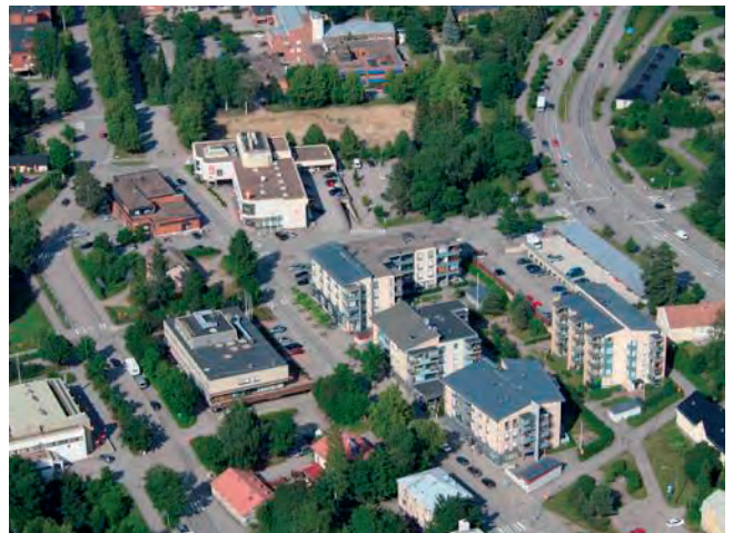
Ilmakuva Hyrylän keskustasta 2013.

hallinnollinen ja kaupallinen keskus on myöhemmin kehittynyt. Liikekeskusta on rakentunut 1900-luvun kuluessa kauppatien varteen ja viime vuosina keskusta on kehittynyt selvästi kaupunkimaisemmaksi.