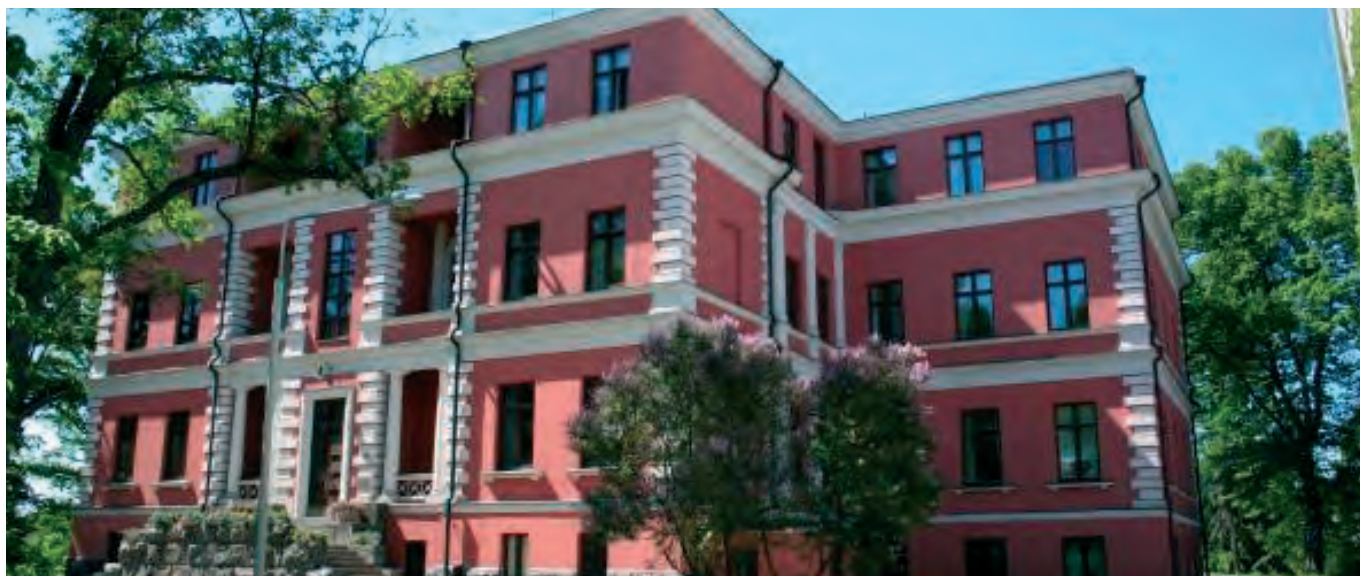
Kellokosken sairaala

Kellokosken sairaala sijaitsee puistomaisessa ympäristössä Keravanjoen itäpuolella. Alueelta löytyy eri ikäisiä sairaalaja asuinrakennuksia, joista vanhin on 1884 rakennettu kartanon päärakennus. Sairaalan alueella ei ole enää ruukin rakennuksia.