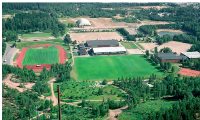
Tuusulan urheilukeskus kesällä 2004