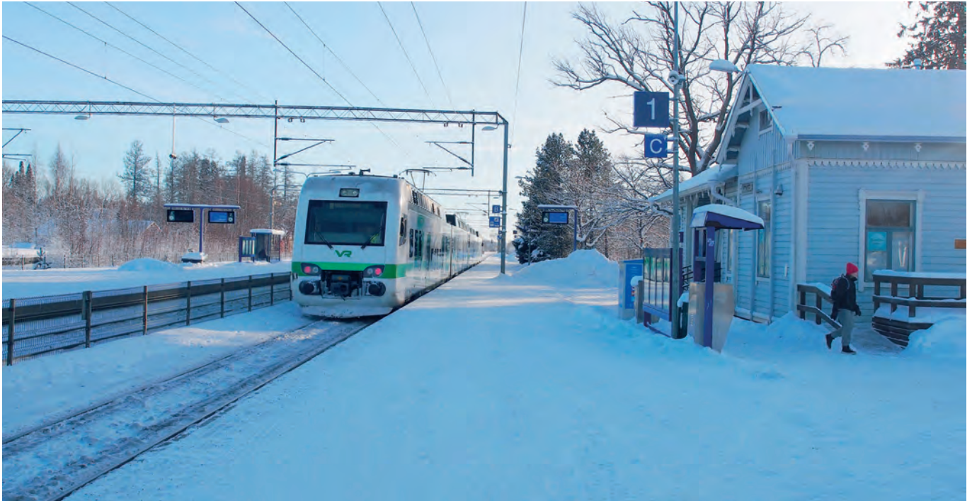
Jokelan asema 2018

Jokelan liike- ja palveluskeskusta sijaitsee risteävien teiden ja raideyhteyden muodostamassa liikenteen solmukohdassa. Pientalovaltaiset asuinalueet ovat rakentuneet paikallisteiden ympäristöön. Jokelan historiallisesti arvokas tiilitehtaan ympäristö kuuluu valtakunnallisesti merkittävät rakennetut kulttuuriympäristöt (RKY 2009) -alueeseen. Jokelan julkiset viheralueet ovat katualueita, rakennettuja puistoja, käyttöviheralueita, ulkoilun ja liikunnan alueita, lähimetsiä ja käyttöniittyjä.