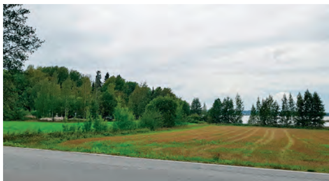
Viljelyaukeilta avautuu paikoin näkymiä Tuusulanjärvelle

Rantatien katutila tulee itsessään säilyttää. Sen mitoitusta, linjausta tai pintamateriaaleja ei saa muuttaa. Rantatien maiseman, näkymien ja kasvillisuuden hoito tulee toteuttaa Tuusulan Rantatien maiseman hoito -selvityksessä (2000) huomioitujen kulttuurihistoriallisten arvojen mukaan. Täydennysrakentamisen on kunnioitettava vanhaa rakennuskantaa. Vastakohtaisuuksia, erilaisuutta, eri tyylin kerroksia ja kontrasteja vältetään rakentamisessa. Kattomuoto alueella on harjakatto ja rakennusten materiaali on pääosin puu. Rakennusten värit ovat maavärejä ja puunvärejä, kuten punamultaa ja keltaokraa. Alueelle rakennettuja kulttuurimaisemasta poikkeavia rakennuksia voidaan peruskorjausvaiheessa tutkia purettaviksi.